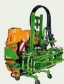
Opryskiwacz zawieszany UF, 900 / 1200 litrów