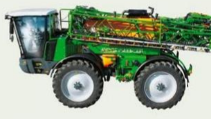
Opryskiwacz samojezdny Pantera, 4000 litrów, 24 - 40 m