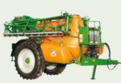
Opryskiwacz zaczepiany UX, 3200 / 4200 / 5200 / 6200 / 11200 litrów