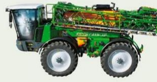
Selbstfahrer Pantera 4000 Liter, 24 bis 40 m