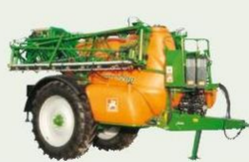
Feldspritze UX, 3200/4200/5200/6200/11200 Liter