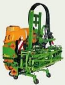
Feldspritze UF, 900/1200 Liter