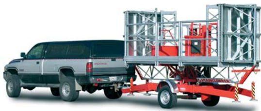
Leichter Transport auf Trailer Chassis

Max. Plattformlänge bis 10 mtr bei Einzelmastversion, Max. Plattformlänge bis 25 mtr bei Doppelmastversion