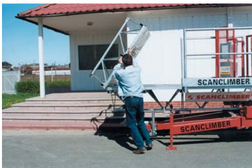
Montage: schnell und unkompliziert mit nur 1 Person