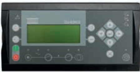
* Optional ab 80 kVA

Wir haben dafür ein einzigartiges Power-Management-System (PMS) entwickelt. Das PMS ermöglicht die Optimierung des Kraftstoffverbrauchs und verlängert die Lebensdauer des Stromerzeugers. Es steuert die Anzahl der parallel laufenden Generatoren nach dem aktuellen Energiebedarf und startet bzw. stoppt Einheiten, wenn die Last steigt oder abfällt. Auf diese Weise bleibt die Last für jeden Stromerzeuger auf einem Niveau, das den Kraftstoffverbrauch minimiert. Die Stromerzeuger müssen auch nicht mit zu niedriger Last laufen, was Motorschäden verursachen und die Lebensdauer der Ausstattung verkürzen kann.