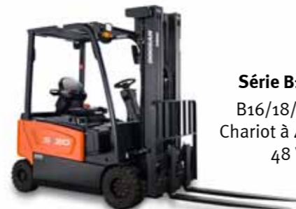
Série B18X-7 B16/18/20X-7 Chariot à 4 roues, 48 V