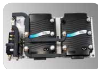
Fonctionnement stable et fiable Variateur Curtis indice de protection IP65