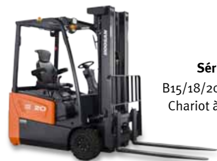
Série B18T-7 B15/18/20T-7, B18/20TL-7 Chariot à 3 roues, 48 V