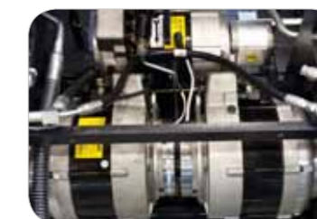
Moteurs de pompe et traction de type fermé indice de protection IP43 simple et puissant