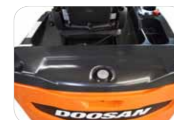
Contrepoids à forme arrondie