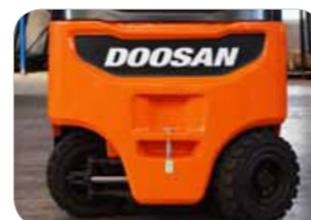
Angle de direction optimisé BT (chariot à 3 roues) : 90° BX (chariot à 4 roues) : 86°